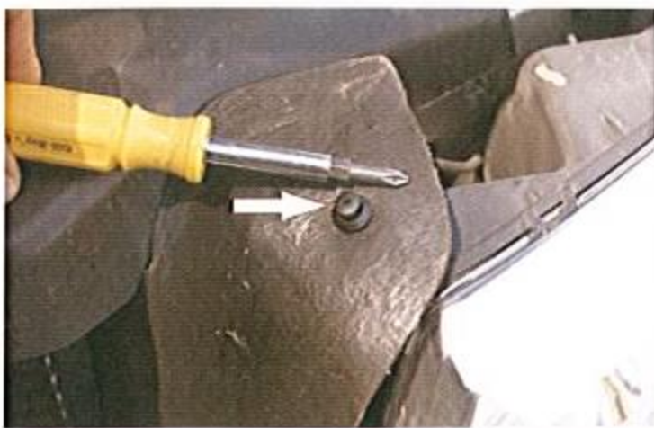
Le schéma 1