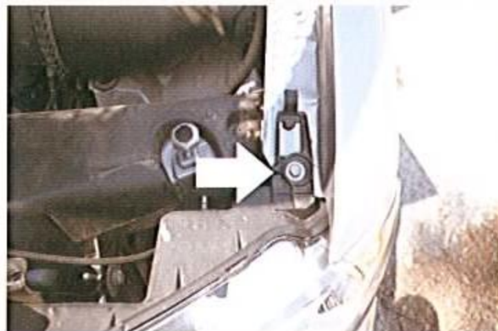
Le schéma 2